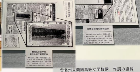
台北州立蘭陽高等女學校 作詞的經緯